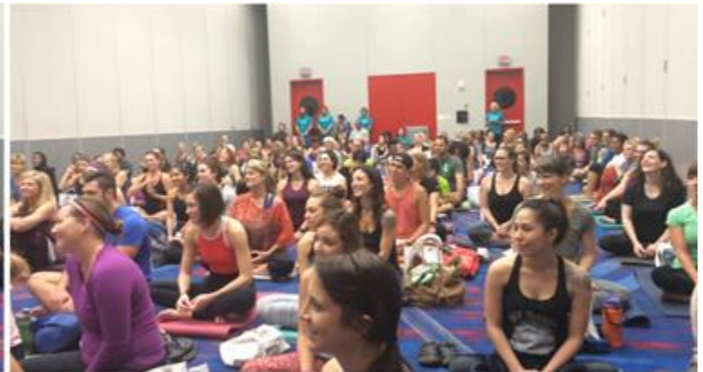
Thiền Sư khai mở Tuệ giác cho người bản xứ tại Yoga Expo