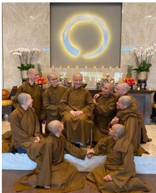
Thầy trò bên nhau tại chánh điện Thiền Viện Phổ Môn

(1) Đối với người chưa có trần trở nhiều, Thiền sư giúp họ trực nhận khổ đau là do chính nguồn mê chấp gây ra, từng bước khai thị