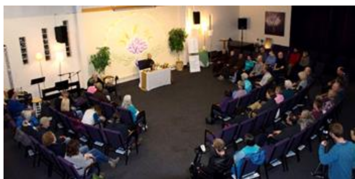
Thiền sư khai thị Chón về Giác ngộ cho các vị Giáo sư trường đại học Western Michigan và những chuyên viên hướng dẫn Thiền