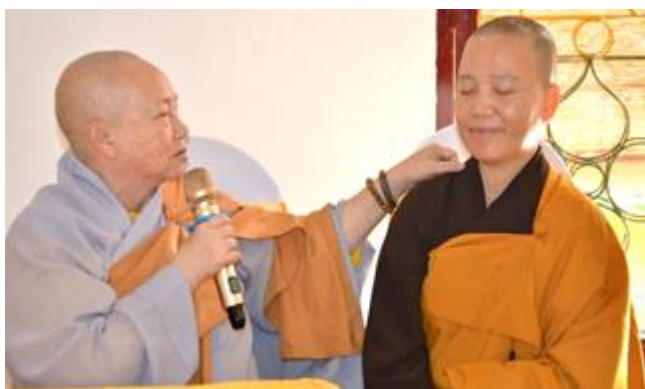
Ni trưởng thân thương chào đón người học trò năm xưa mang Ánh sáng Giác ngộ trở về.