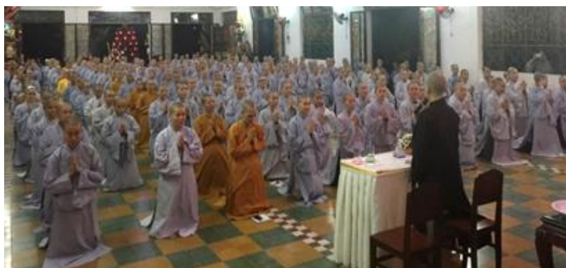
Ni chúng tại Ni Viện Thiện Hòa tha thiết đón nhận sự khai mở về mục tiêu tối thượng của người xuất gia là Giác ngộ, giải thoát.