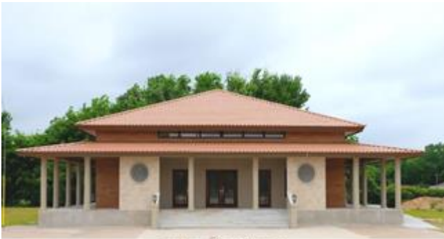
Thiền đường Thiền Viện Phổ Môn