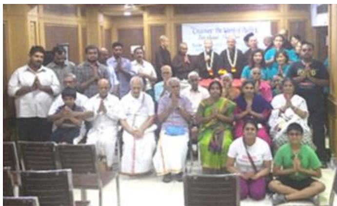
Buổi Khai Mở Tuệ giác cho gia đình Sư cô Phổ Niệm tại Chennai, Ấn Độ