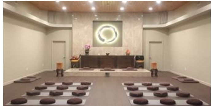
Biểu tượng Vòng tròn Tâm Giác Ngộ bên trong Thiền đường Thiền Viện Phổ Môn

Năm 2003, Thiền sư thành lập Thiền Viện Phổ Môn rộng 1 acre ở Houston, Texas, đến năm 2017 di dời đến địa điểm mới, thông thoáng, rộng 9 acres.